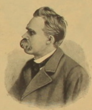
Ն ի չ Ե .

նկնց այն օրը, երբ կը բացեն իր բանտի դռները, նա նորից կը լինի այդ դաշտերում և անտաններում, չի կասկածում, որովհետև նա այդ բոլորը տեսնում է և գիտէ, որ այդ բոլորը զոյութիւն ունի: