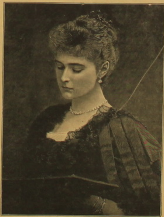
ՆՈՐԻՆ ԿԱՅՏԱՐԱՐԱՆ ԿԱՅՏԱՐԱՐՈՒՄԻ ԲԱՅՈՒՆԻ ԿԱՅՏԱՐՈՒՄԻ Ալեխանդրա Ֆեօդորովնա Հիմնադիր աշխատանքի սերի Ռուսաստանում

Մեր սիւնեցեալ Քաղաքի Կայսերանի Ալեխանդրա Ֆեօդորովնան հովանաւորում է և գեղարեստ ու ինքն էլ սիրամար է գեղեցիկ արեւսին: Օգոստափառ Կայսերանու լու-