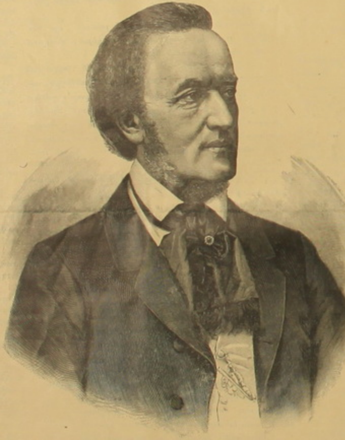
Վ ա գ ն Ե .

տարութիւնից, մասամբ էլ «Քաշող նոյնալի»-ից, որի բանաստեղծութեան բնագիրը ծախել էր Փարիզի «Մեծ երաժշտարան»-ին, շուտով Գաուլ Ֆուշէն Ֆրանսերէնի փոխադրեց, իսկ Դիլը մի նոր երաժշտութիւն յօրինեց և ներկայացրին «Le Vaisseau fantôme» անունով։ Վագներ հրաժեշտ տուաւ Փարիզի արկածալի կեանքին և Գերմանիա դարձաւ (1842), Հայրենիքում դիմաւորեց նորան անդրանիկ փառքը։