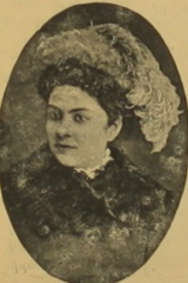
Տ. Հ ր ա շ ի ա յ .

ներկայութեամբ, իր կրթչտութեան բարեկամների (և Սնու-միներ) ետանդուն աշակցութեամբ, դրին Բայրոյթում ազգային հանդիսարանի (Festspielhaus) հիմնադրութիւնը: Չուտ զեղարեւտագէտների խումբն էլ նապեց Բեթհովենի ինկրորդ Միոֆունին վարպետներն (Հանս Րիխտերն էլ նմանար էր) և հանդէսը փակեց: «Վագներիան ընկերութիւն»-ը ժրջան կերպով աշխատեց և հաւաքեց 900,000 մարք